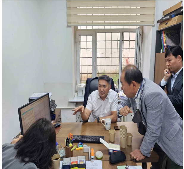
몽골 잔치브도르지갈 토지행정청 인프라 국장과 몽골 주소법령 개정 방향 토론