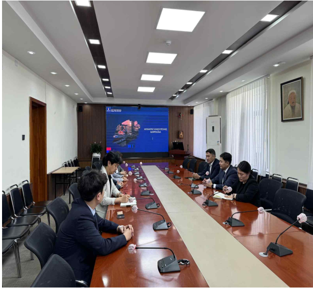
몽골 엔크만라이 아난드 토지행정청장과 한국 주소전문가 면담 (몽골 주소체계에 한국주소 적용 방안)