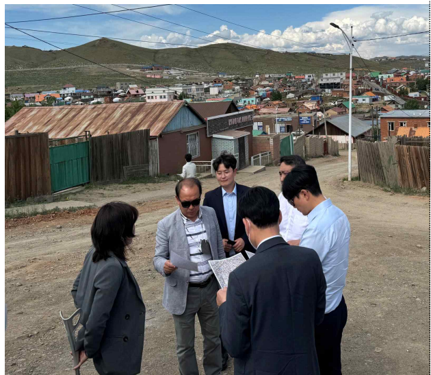
몽골 토지행정청 실무자와 울란바토르시 지역별 주소부여 방안 마련 현장 점검