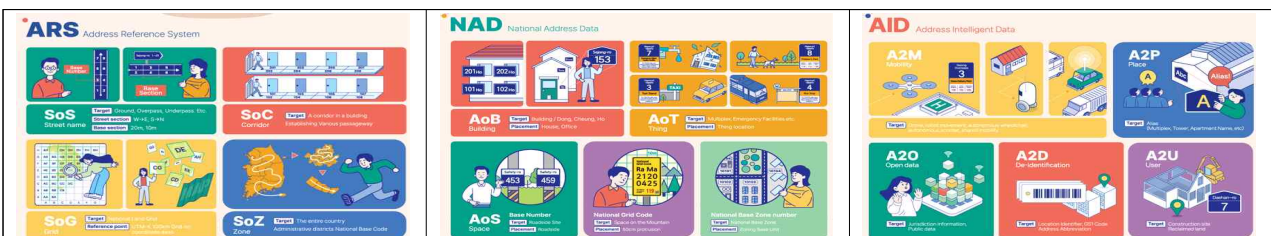
(4) 동영상 송출 TV(K-주소 우수성, 2030부산세계엑스포)